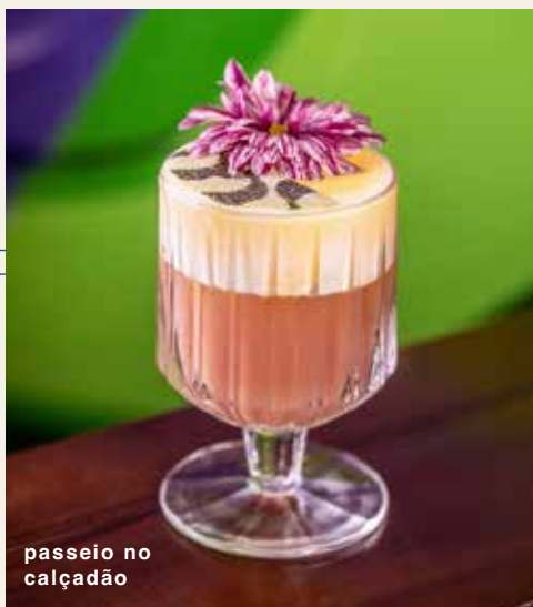
passaio no calçadão