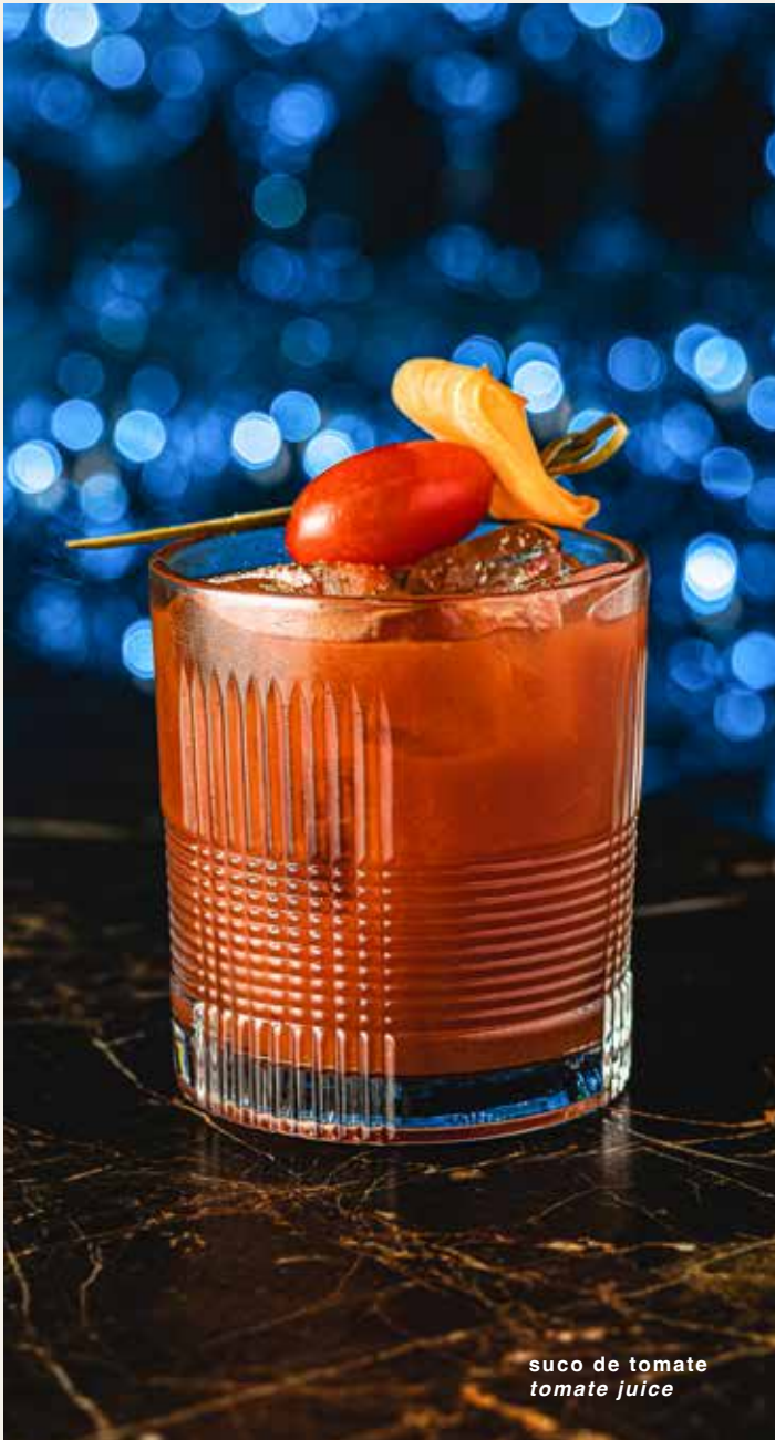
suco de tomate tomate juice