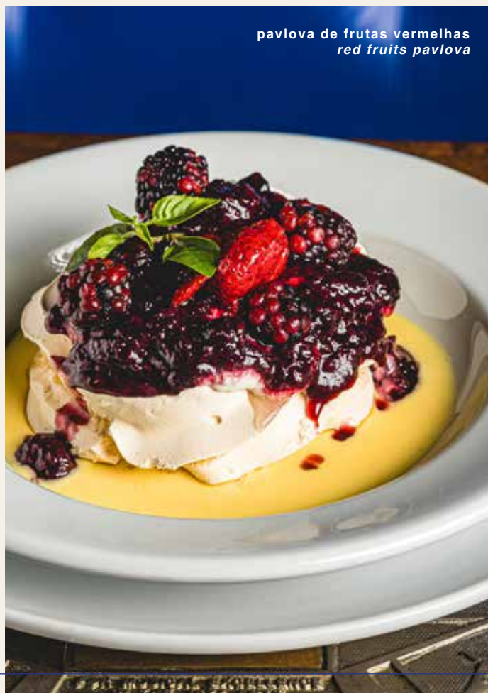
pavlova de frutas vermelhas red fruits pavlova

red fruits, meringues, whipped cream and creme anglaise.