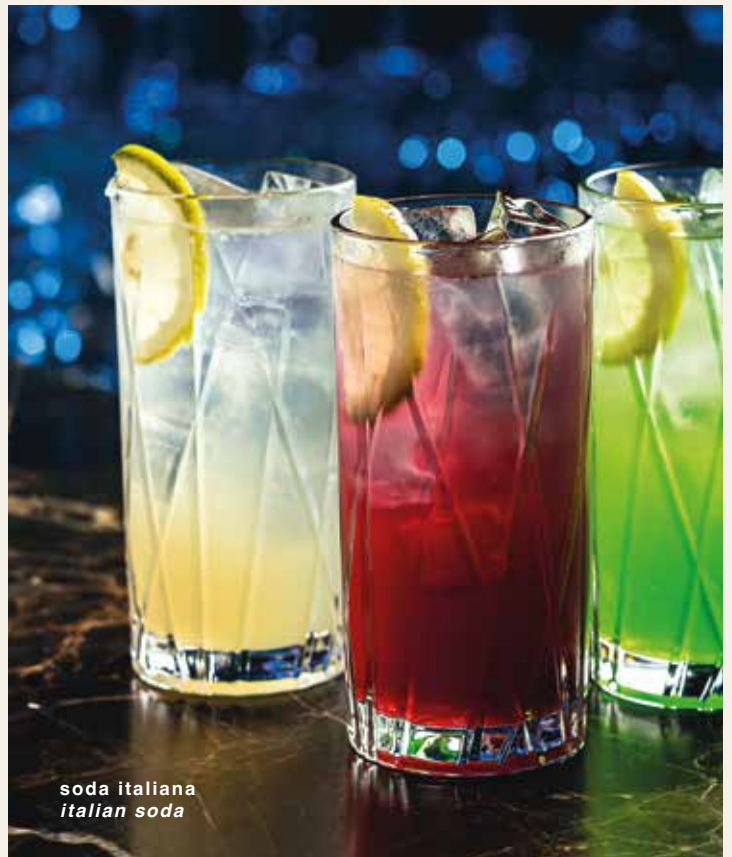
soda italiana italian soda